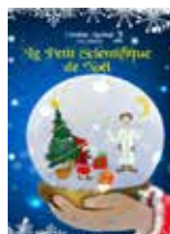
Le petit scientifique de Noël