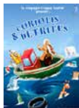
Coriolis & Detritus