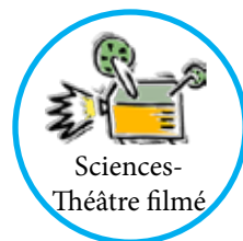
Sciences- Théâtre filmé